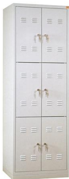
Szafka schowkowa sześciodrzwiowa